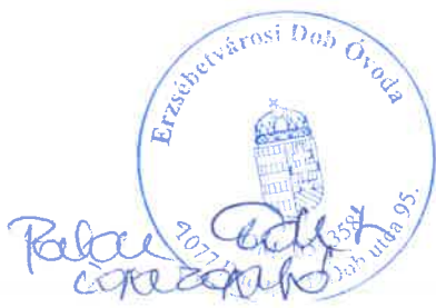
Puskás Éva (logopédus)